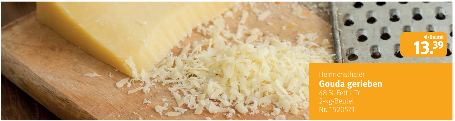
Heinrichsthaler Gouda gerieben 48 % Fett i. Tr. 2-kg-Beutel Nr. 1520571